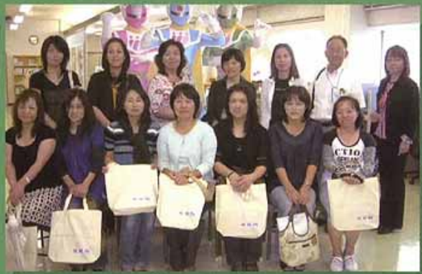
小林市立南小学校しらはぎ学級の14名の皆様