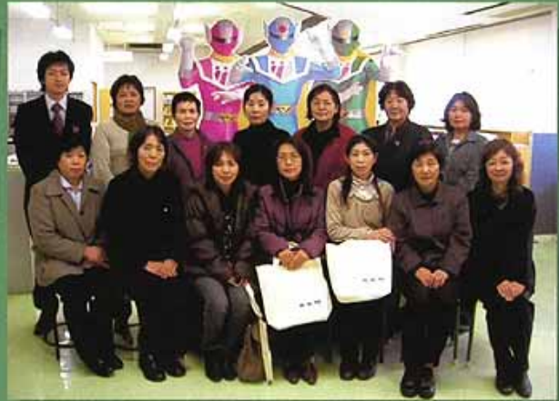
椎葉村地域婦人連絡協議会の14名の皆様

平成21年6月26日(金)に、小林市立南小学校しらはぎ学級(家庭教育学級)の皆様が当センターを研修視察に訪れ、「わたしたちの人権講座(子どもの人権について)」を受講されました。