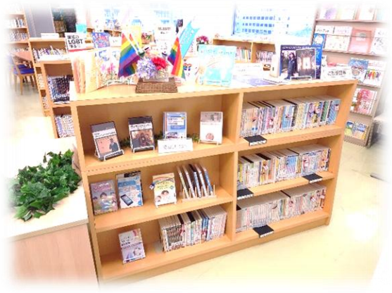
【人権啓発センターの様子】