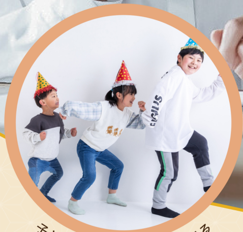
子どもたちが笑顔で活動できる