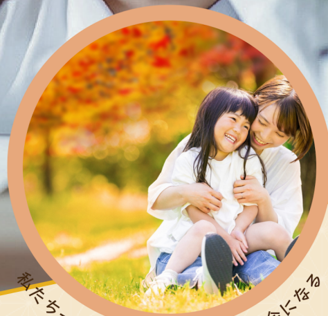
私たち一人ひとりが尊重される社会になる