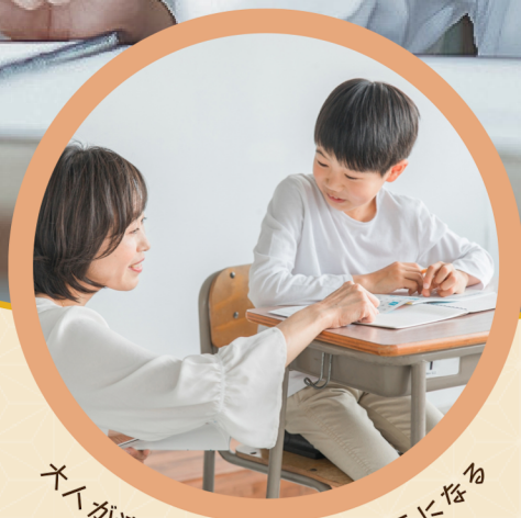
大人が適切な支援をできるように